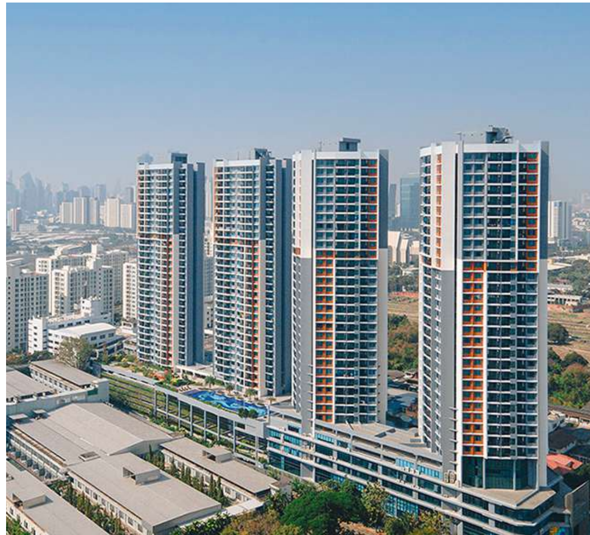
The Artisan, Таиланд