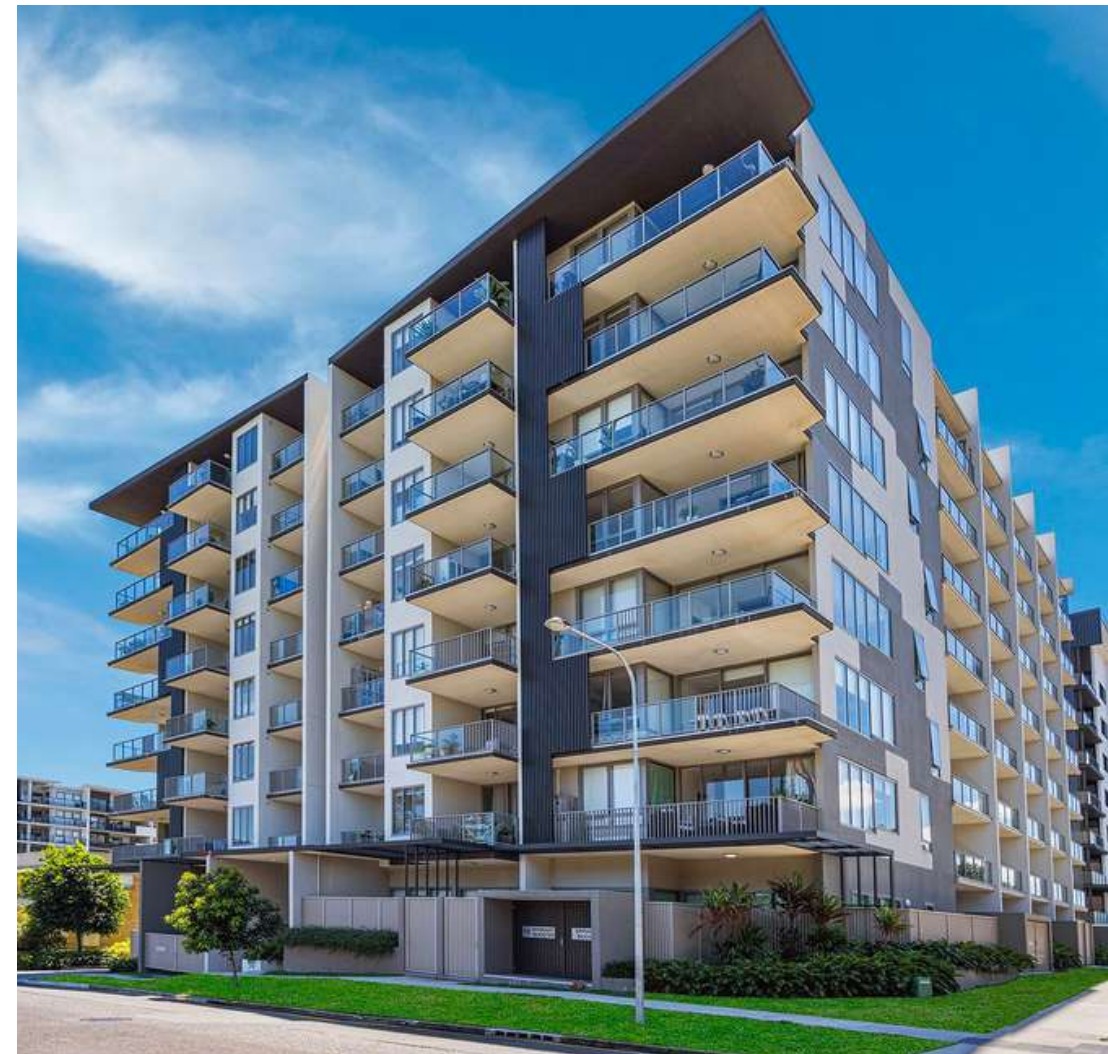
Lincoln on the Park, Австралия

https://propertymash.com/brisbane/brisbane-south-east/lincoln-on-the-park-investment-apartments-in-stones-corner/