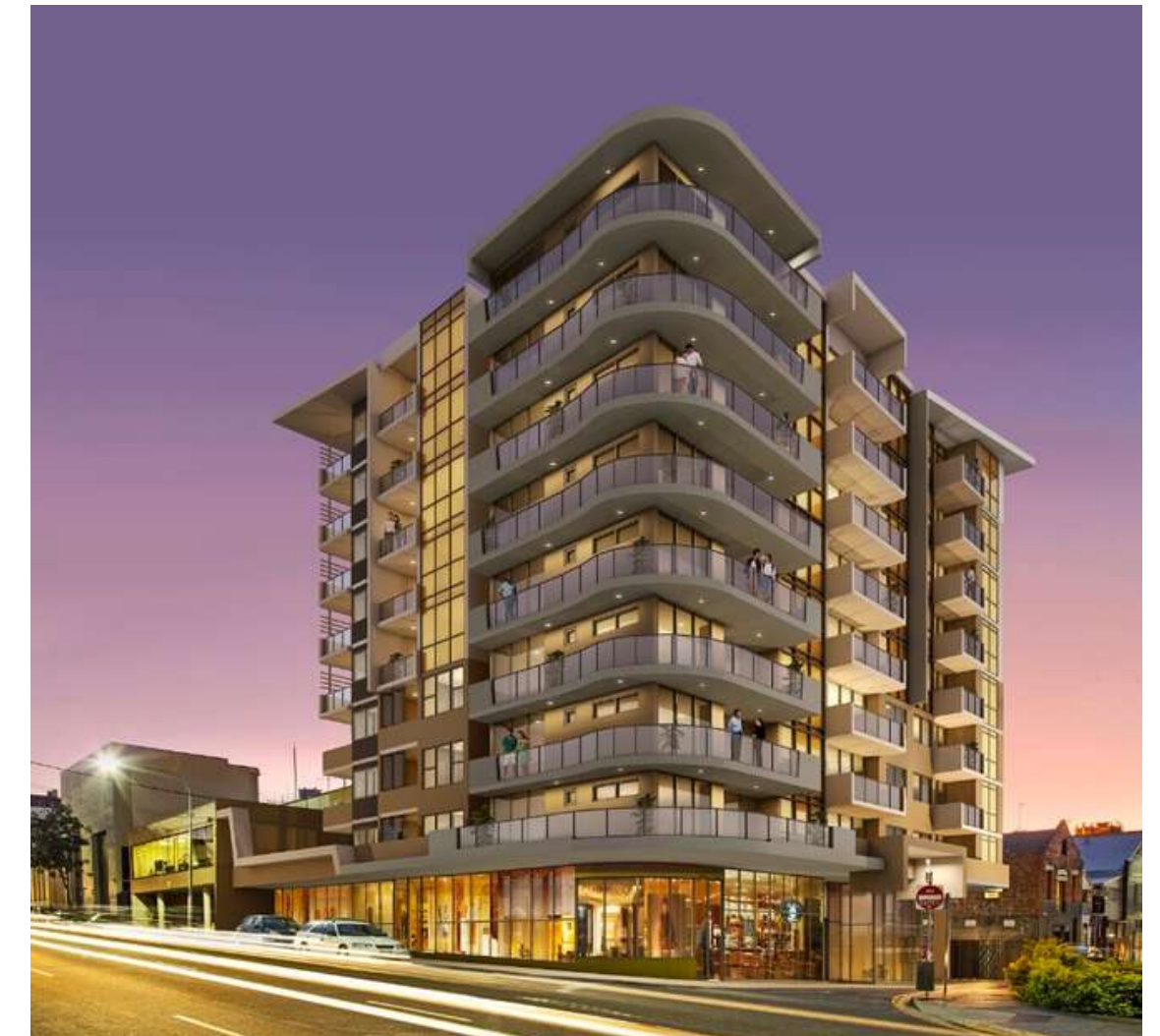
Thee Winn, Австралия

https://propertymash.com/brisbane/brisbane-south-east/lincoln-on-the-park-investment-apartments-in-stones-corner/